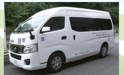
収益金により購入された福祉車両