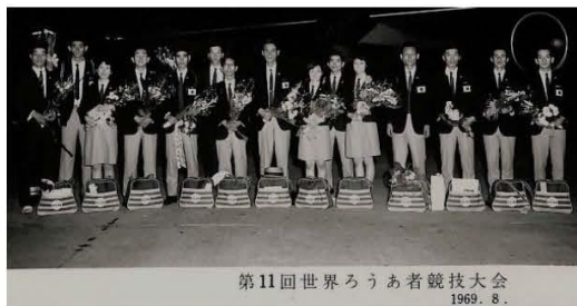
第11回世界ろうあ者競技大会 1969. 8.