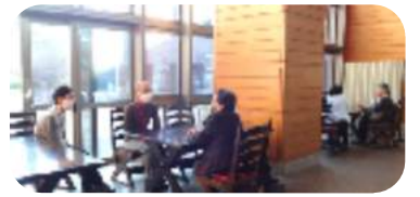
暖かな日差しのもとリラックスしながら

コロナ禍で井戸端会議もめっきり減ってしまった今日この頃…誰かへ伝えたい思いを傾聴ボランティア“ハピネス”のスタッフがお聴きします。その内容が口外されることは決してありませんので、安心してお気軽にお越しください。