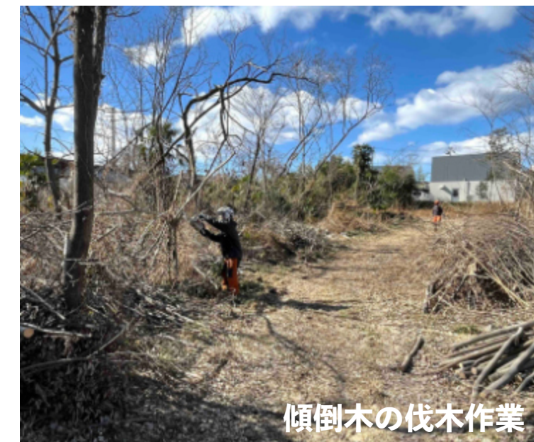
傾倒木の伐木作業