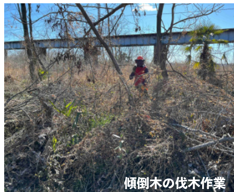
傾倒木の伐木作業