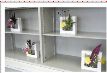
福生市いけばな合一会