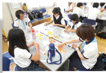
ホスピタルアート折り紙