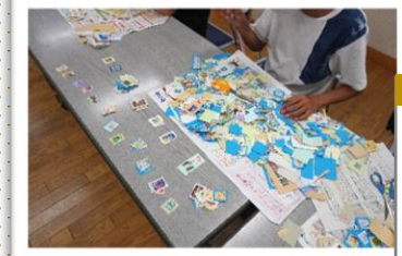
整理ボランティア