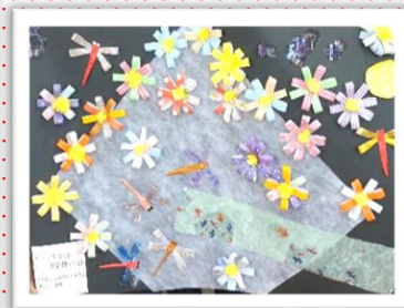
ホスピタルアート折り紙