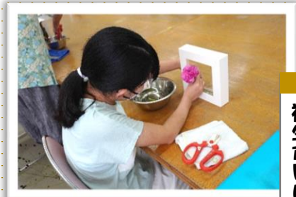
福生市いけばな合一会