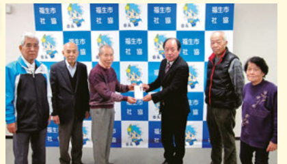
去る2月の老人クラブ三役会にて社会福祉協議会へ報告いただきました。

老人クラブの皆さんから友愛募金を寄附していただきました。福生市老人クラブ連合会より、毎年実施されております友愛募金を福生市社会福祉協議会にご寄附いただきました。友愛募金とは、1円玉募金から始まった経緯があり、老人クラブに参加されている皆様の助け合いと思いやりの気持ちにより、実施していただいております。改めて心より感謝申し上げますとともに、地域福祉の増進、ボランティア・市民活動の推進の各種事業に使用させていただきます。(令和5年12月21日現在)