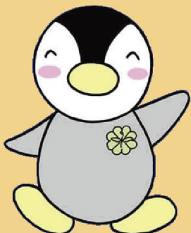
民生委員・児童委員イメージキャラクター「ミンジー」