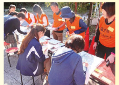
災害ボランティアセンター設置運営訓練 ボランティア受付の様子

「力仕事なら任せてください！」 「話を聞くことならできます」など、全国から駆けつけてくれるボランティアの方々を受け付け、活動内容の希望やスキルなどを聞き取ります。