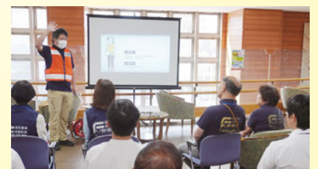
災害ボランティアセンター設置運営訓練 ボランティアマッチングの様子

ボランティア活動に必要なスコップや土のう袋などの資機材の貸し出し、ボランティア保険の手続き案内など、活動がスムーズに進むよう裏方で支えます。