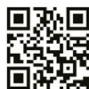
「受験生チャレンジ」サイト 二次元コード