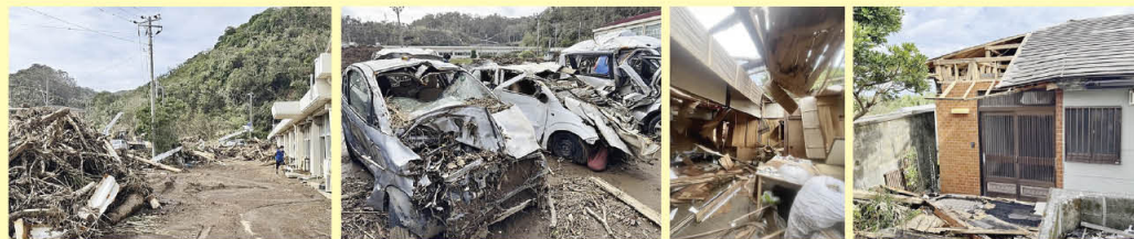
東京都八丈町（八丈島）の被災状況（令和7年10月に撮影）