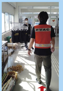
被災地派遣に参加した 福生社協職員