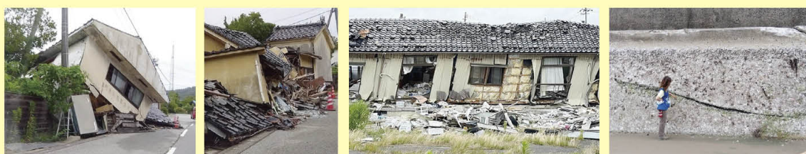
石川県輪島市内の被災状況(令和6年7月に撮影)

令和6年1月1日に発生しました能登半島地震では、停電や断水が長期化しました。自宅に備蓄があった家庭は、避難所に行かずに過ごせたことで安心感が大きかったといえます。備えは「安心を買う」ことにつながります。