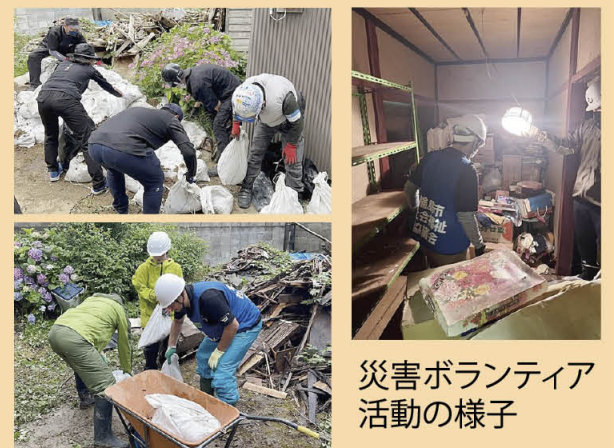
災害ボランティア活動の様子