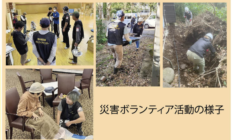
災害ボランティア活動の様子